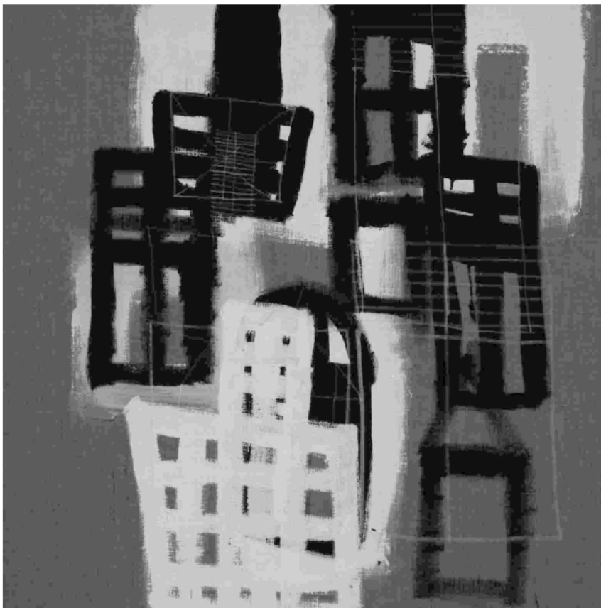
"Rosa Vallonia - Point Europe" (particolare), opera di Riccardo Bargellini e Philippe Dafoseca

Questi hanno lavorato insieme ad artisti outsider durante una residenza di due settimane, per la ricerca di un lavoro congiunto nell'incontro tra le diverse esperienze artistiche, umane e di vita.