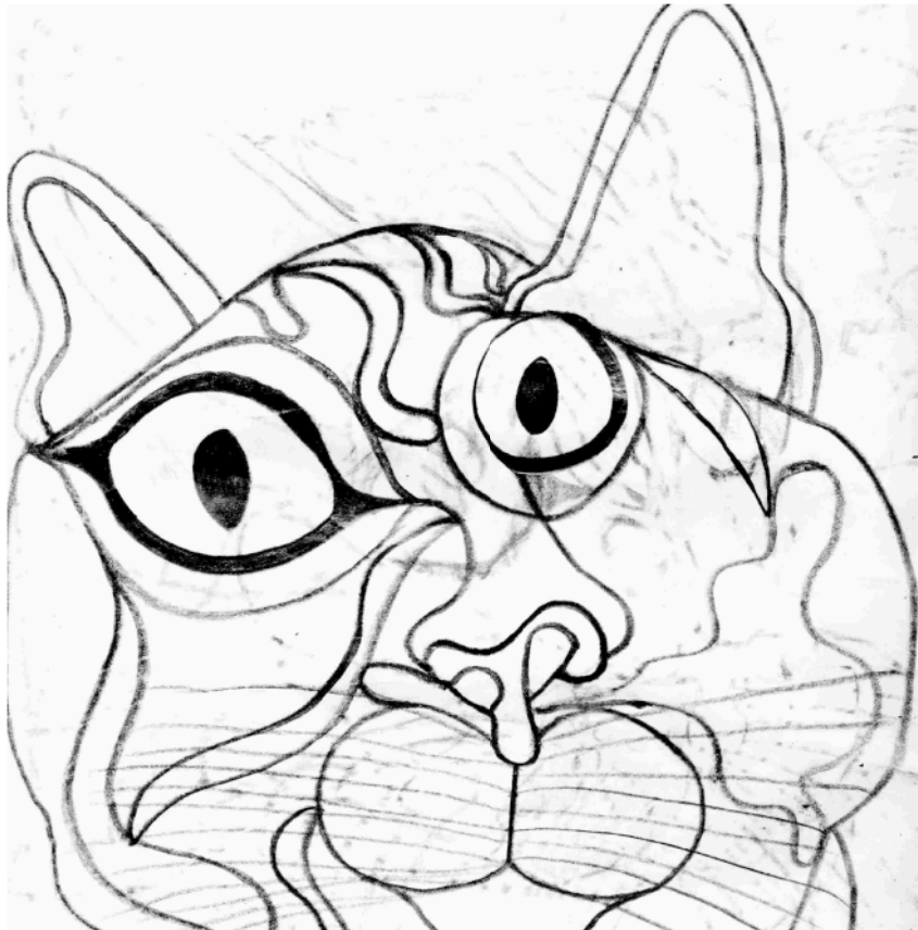
"Gatto" (particolare), disegno di Manuela Sagona, Atelier Blu Cammello Livorno

In collaborazione con le cantanti del Centro Diurno Urlapicchio di Follonica.