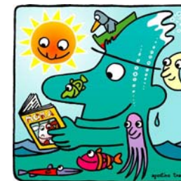
"IL SIGNOR ACQUA" dalla matita di Agostino Traini

La biblioteca svolge anche il servizio di "document delivery", ricerca e reperimento del materiale non posseduto. Si effettua inoltre il servizio di prestito interbibliotecario con le principali Biblioteche che aderiscono a questo servizio.