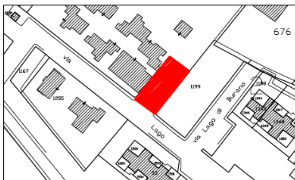
Stralcio scheda n. 7 del Piano delle Alienazioni e Valorizzazioni immobiliari