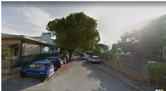
Stralcio immagine google street