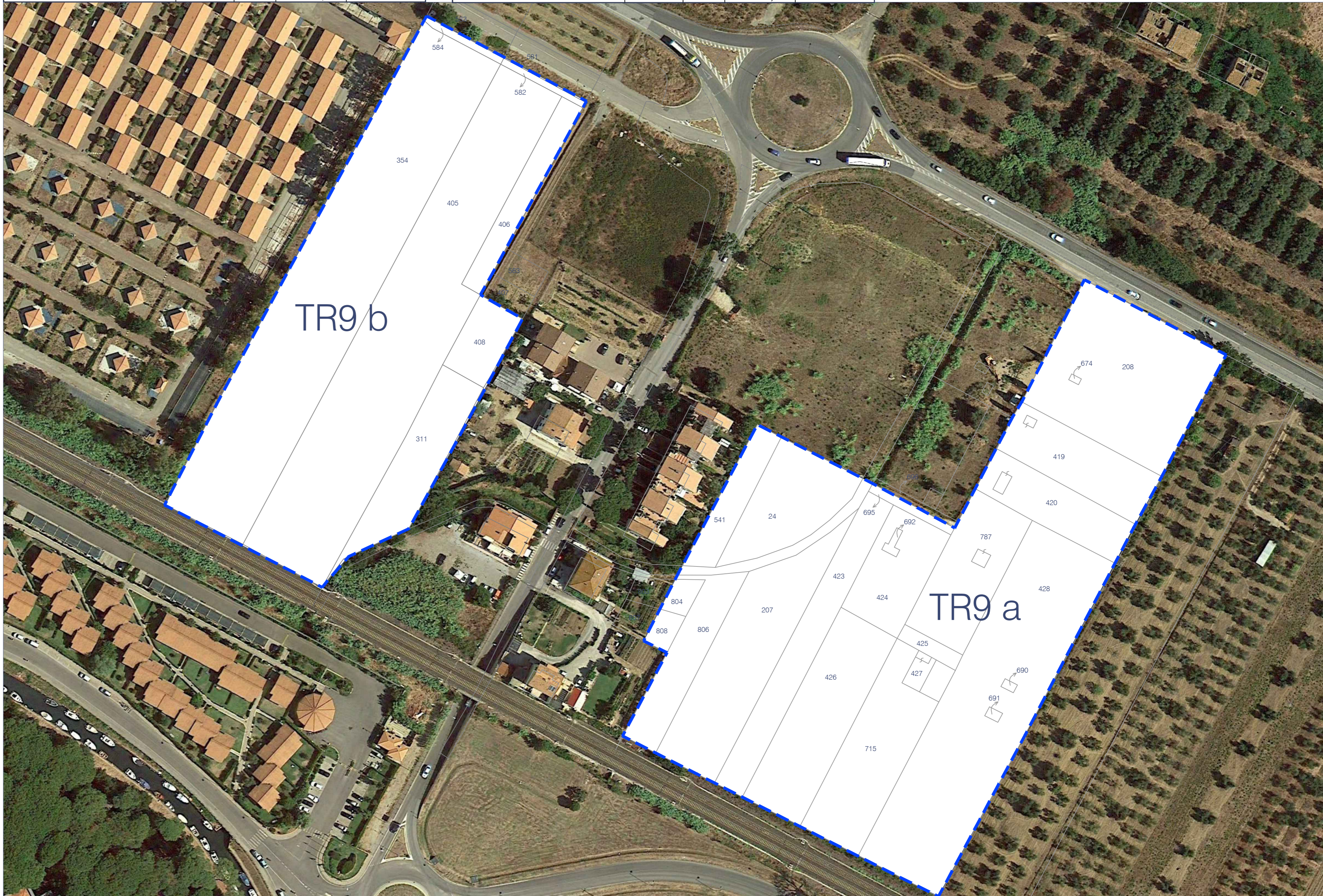
PLANIMETRIA CON INDIVIDUAZIONE PARTICELLE PROPRIETÀ CATASTALI E TABELLE RIEPILOGATIVE DELLE PROPRIETÀ E SUPERFICI