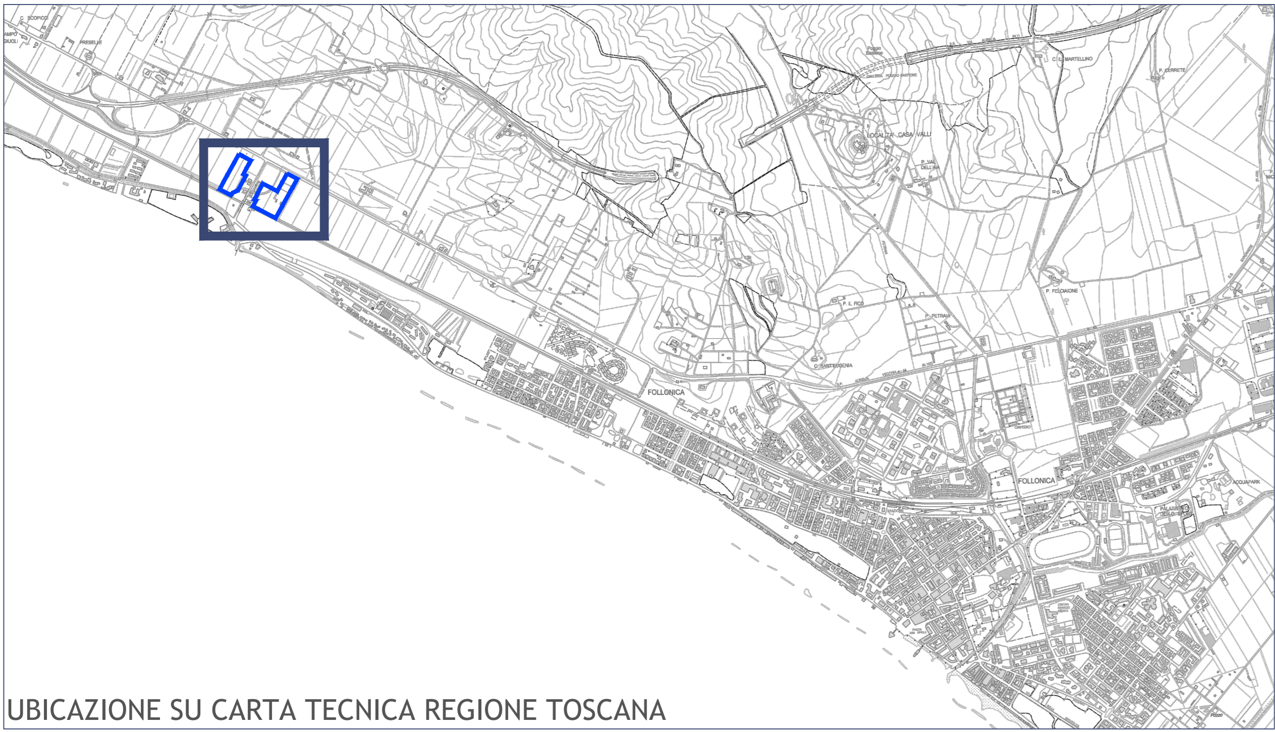
UBICAZIONE SU CARTA TECNICA REGIONE TOSCANA