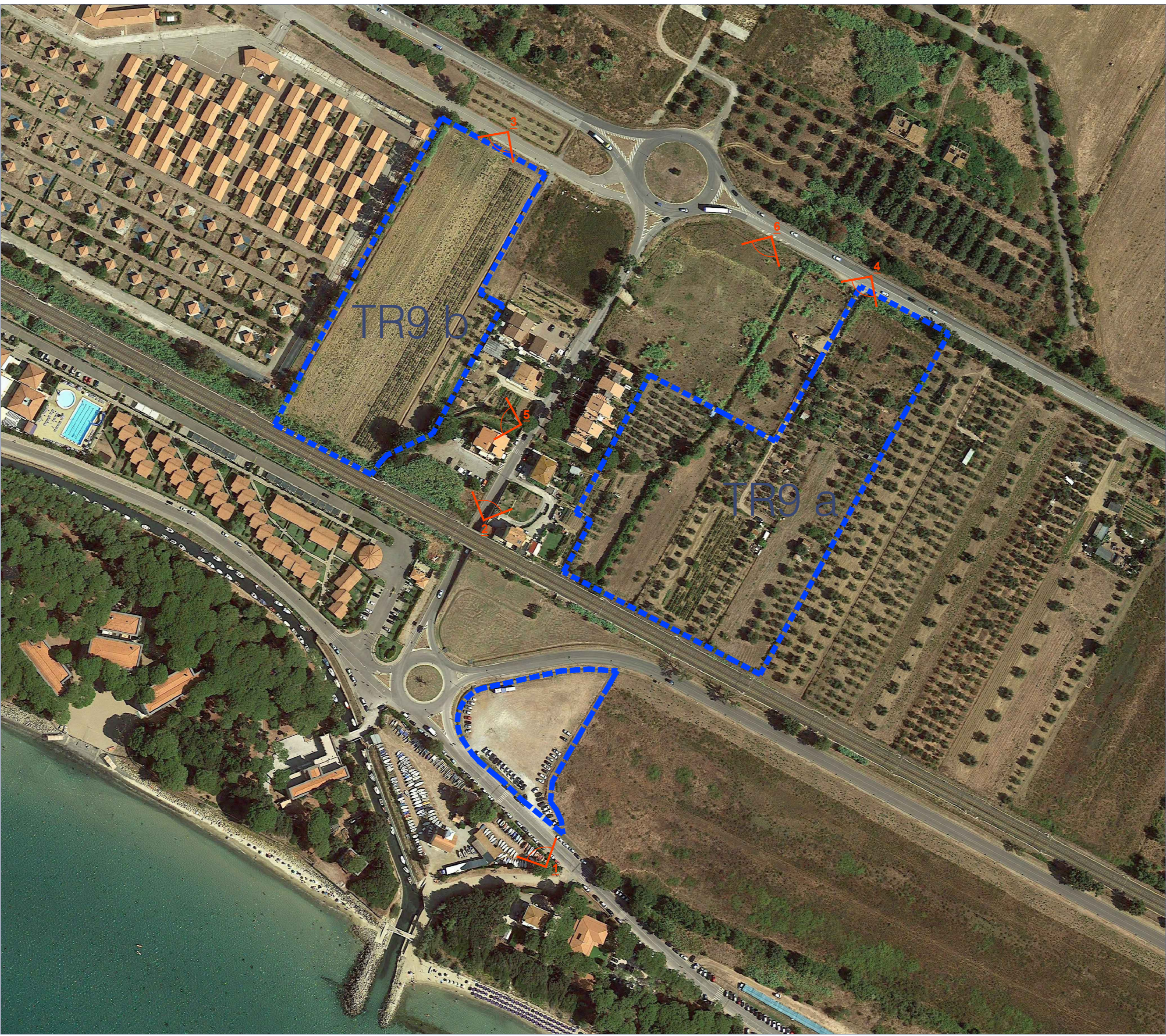
UBICAZIONE SU IMMAGINE AEREA DA GOOGLE EARTH