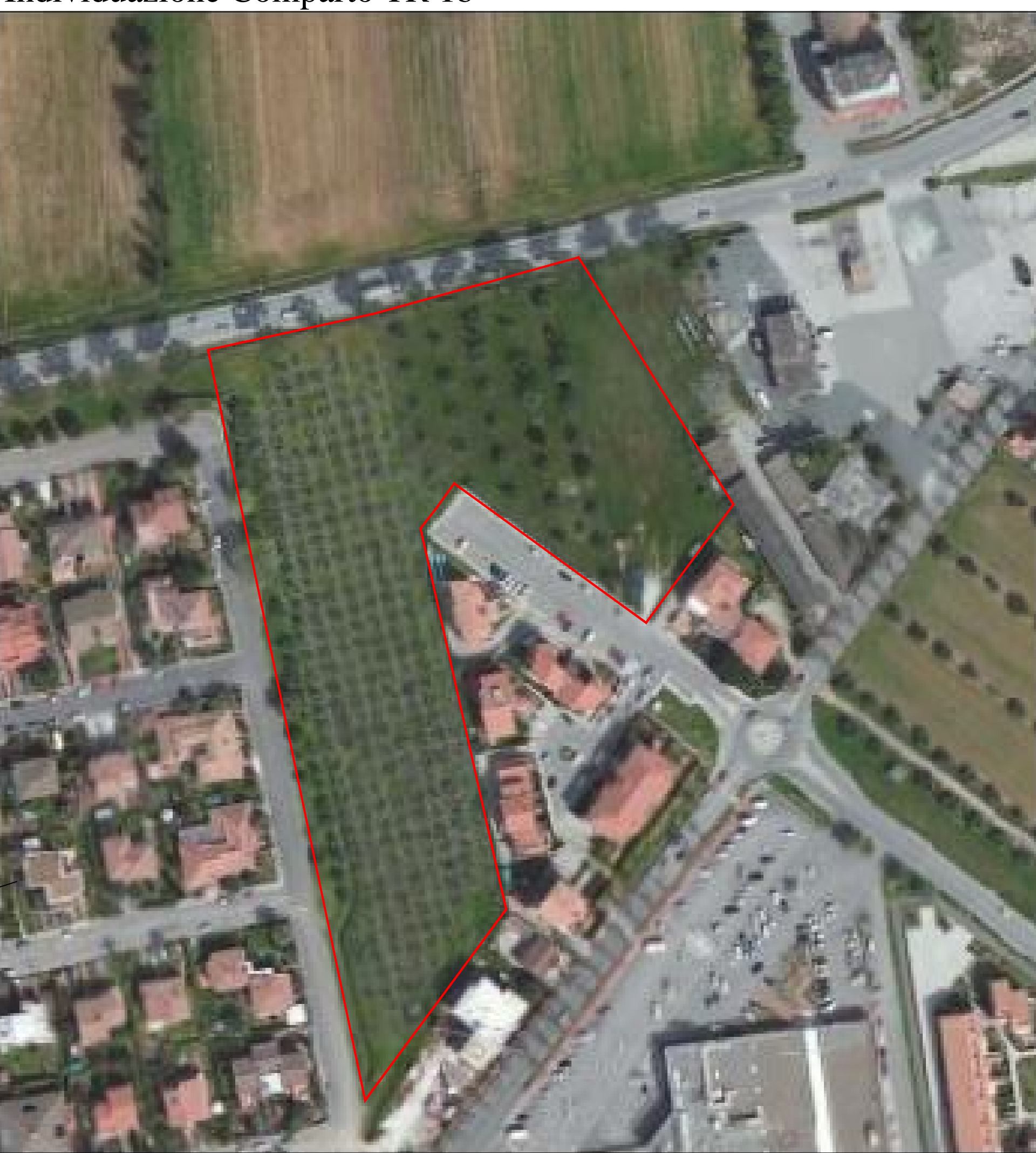
Individuazione Comparto TR 1b