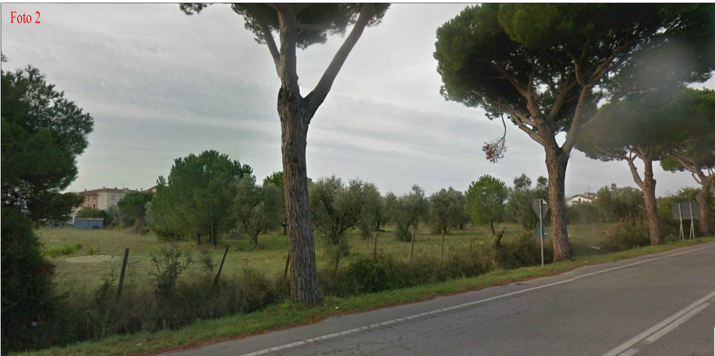
Vista dalla S.P. 152