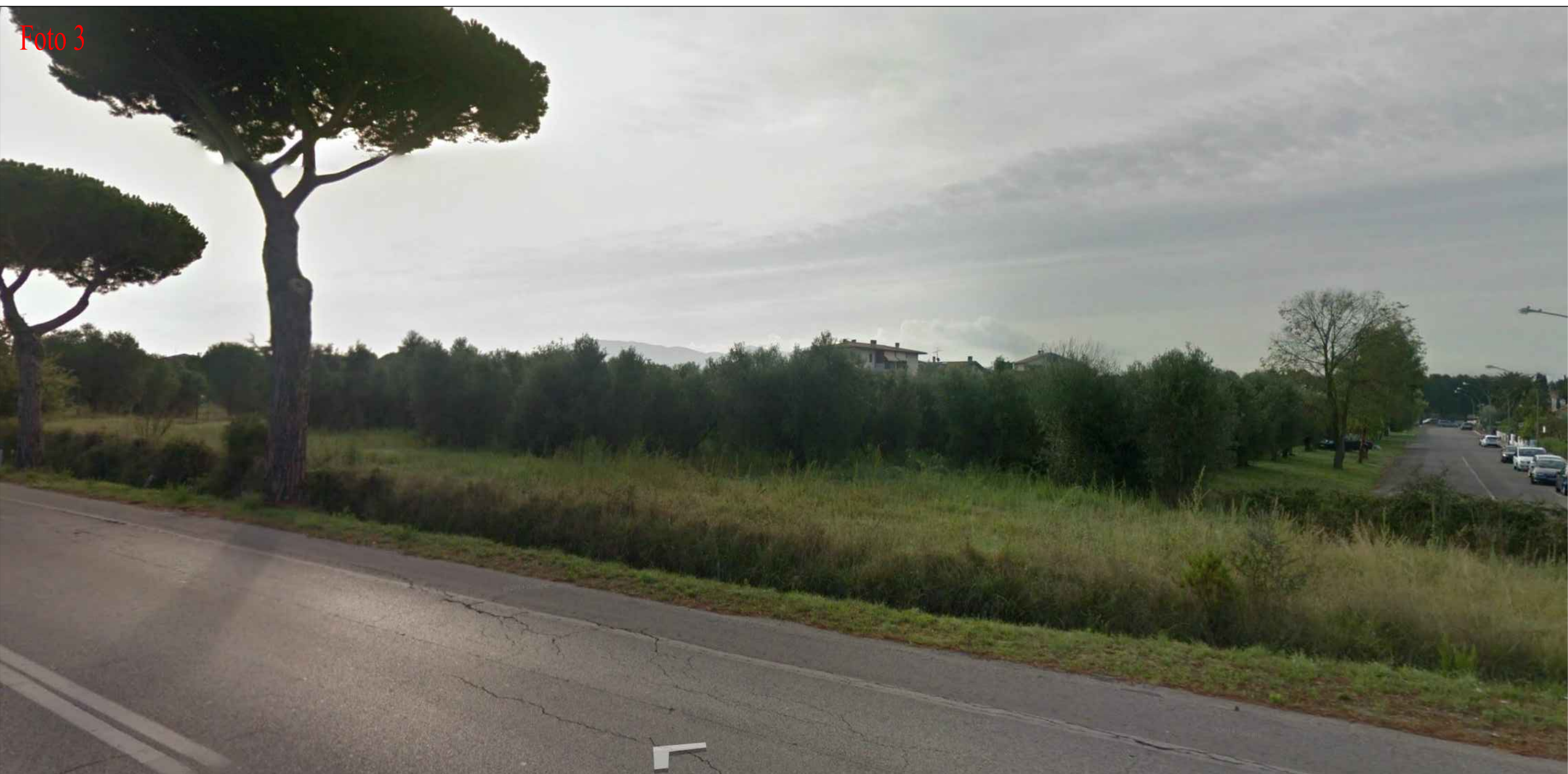
Vista dalla S.P. 152 lato via Pasubio